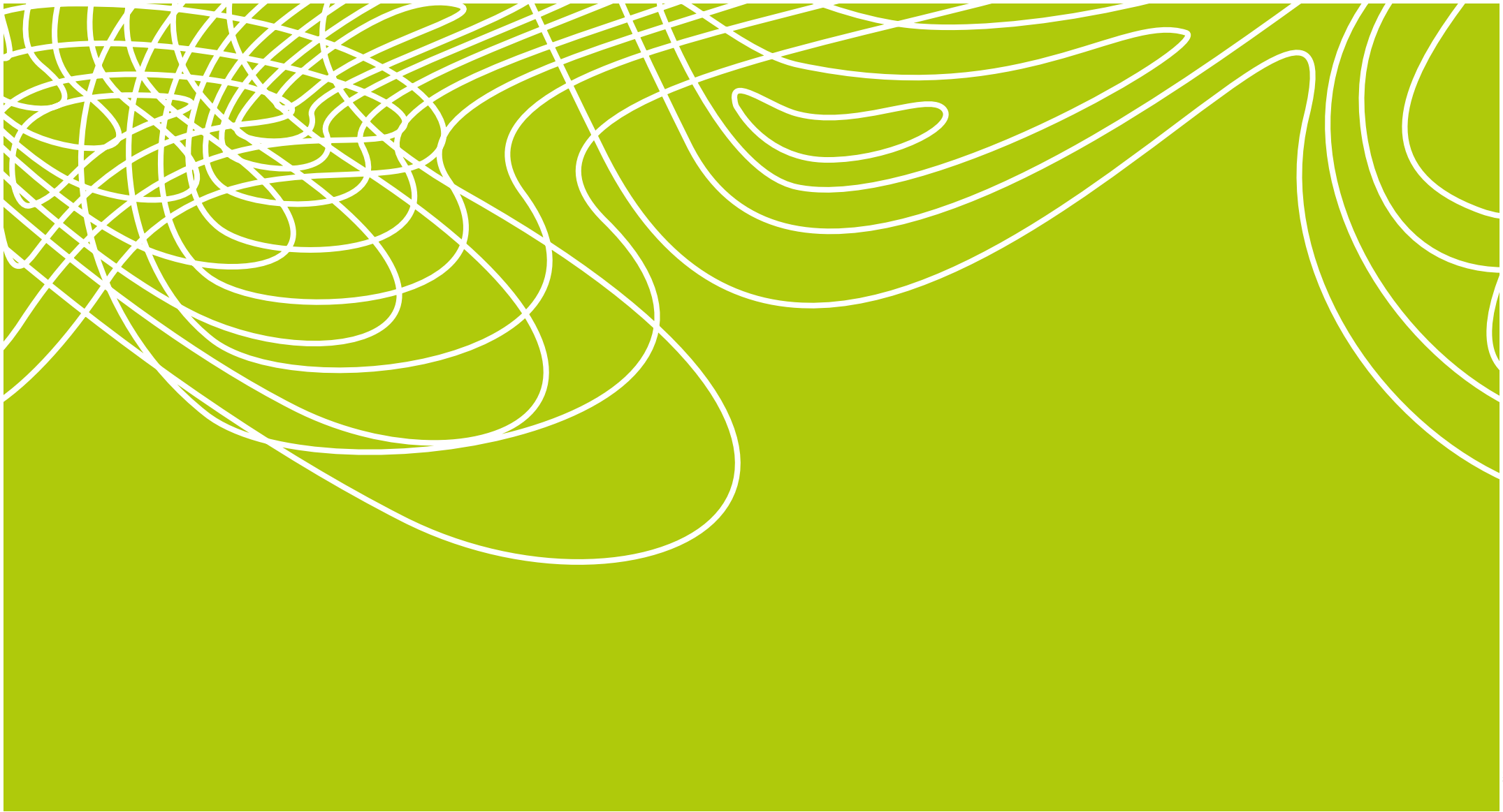
Grafik 17-618 JF